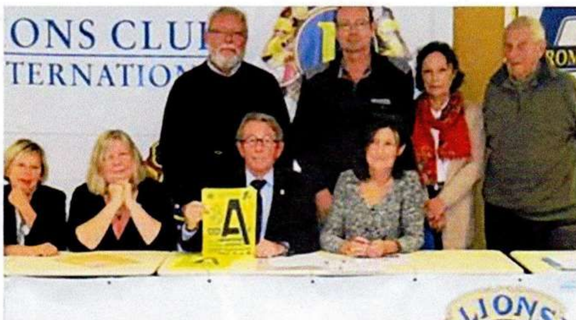
Organisateurs et partenaires se sont retrouvés pour préparer la 22 e édition.

Lundi 16 novembre, à la chambre des métiers et de l'artisanat du Finistère, les organisateurs et les partenaires du salon Foromap 29 se sont retrouvés pour lancer la 22 e édition de ce Forum de l'apprentissage et de la formation en alternance.