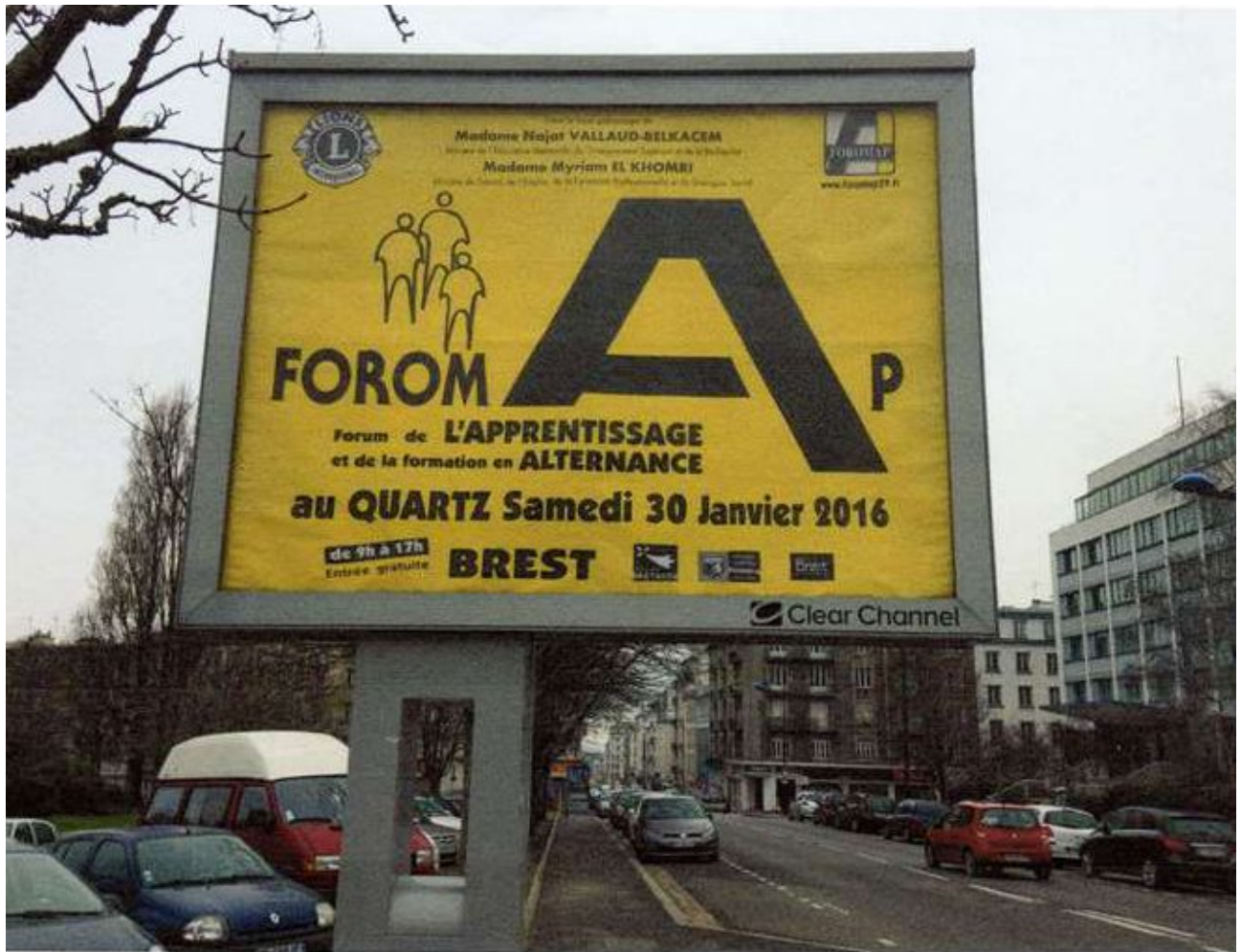
56 Panneaux 306x223 dans le tout BREST MÉTROPOLE