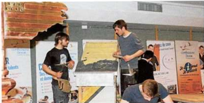
Les Compagnons du Devoir ont fait la promotion de leurs formations, en travaillant comme sur un chantier. Efficace.