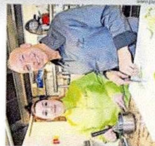
Le restaurant M forme des apprentis sent dix apprentis particulièrement méritants. Renseignements : www.foromap29.fr

L'an passé, 4 300 personnes s'y sont déplacées, parmi lesquelles 2 500 jeunes. Un succès qui va crescendo. En terme d'alternance ou d'apprentissage, la Bretagne appartient au trio de tête des régions les plus formatrices. Chaque année, les organisateurs du forum et le Conseil départemental de Finistère récompen-