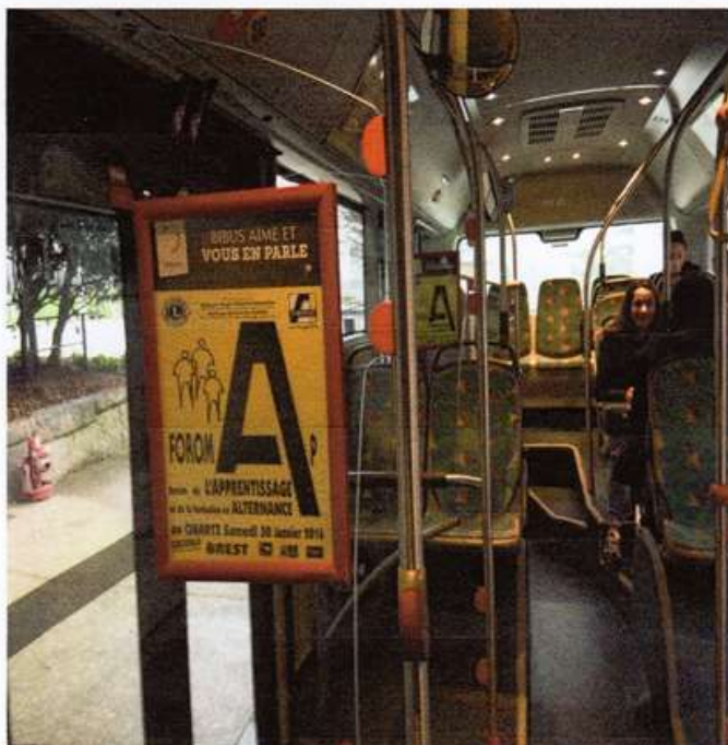
420 Affiches dans le Réseau BIBUS-KÉOLIS