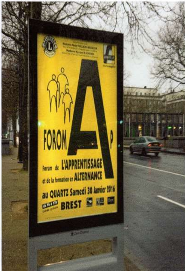
170 Panneaux dans les Villes