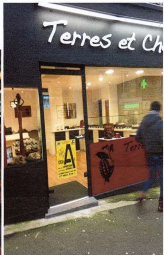
1600 Affiches dans 82 Villes