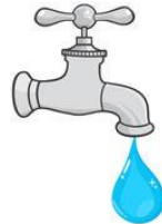
4 verres d'eau