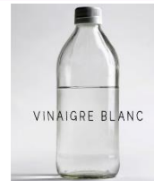
1 verre de vinaigre blanc