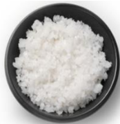
200g de gros sel